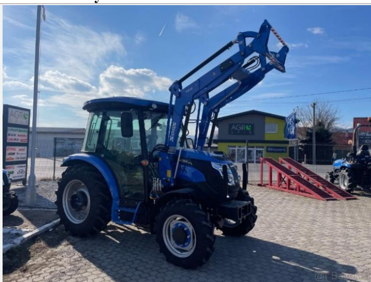
Kompaktibilný k traktorom SOLIS 50 Stage V/